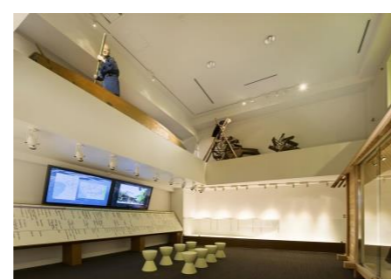
常設展示室のようす