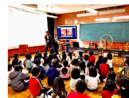
実物資料を用いた解説

10:00 ごろ 資料館スタッフ到着(授業開始20～30分前)、準備 3限目 1組 「糸車・わたくり機たいけん」 4限目 2組 「糸車・わたくり機たいけん」