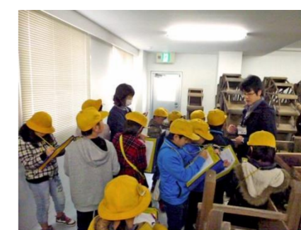
収蔵庫での資料解説

10:00～(5分間) 資料館に到着、集合、あいさつ(トイレタイム) 10:05～(40分間) 1組 【活動A】、 2組 【活動B】 10:45～(40分間) 1組 【活動B】、 2組 【活動A】 11:25～(5分間) 集合、あいさつ(トイレタイム)、資料館を出発